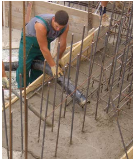
P 718, 32 mm.'e kadar olan taneçikli betonu dağıtabilir/basabilir.

Tüm bunlar P 718'i, özellikle yer/alan sıkıntısı olan inşaat alanlarında kullanılabilen, inanılmaz çok yönlü bir beton pompası yapmaktadır.